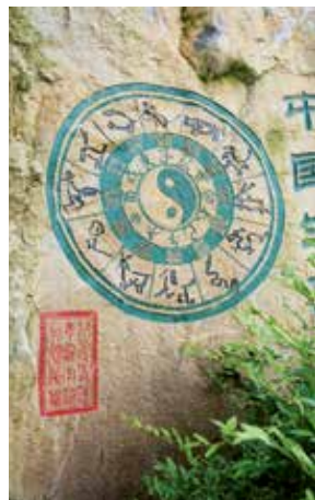
Taiji – das Symbol für Yin und Yang

Wichtig ist, dass Yin und Yang sich gegenseitig beeinflussen, sich gegenseitig hervorbringen und sich gegenseitig verbrauchen. Sie sind zwar gegensätzliche Pole, aber im Yin findet sich der Keim des Yang und umgekehrt. Dies wird durch das bekannte Taiji-Symbol dargestellt: Der schwarze Teil des Kreises symbolisiert das Yin und trägt den Keim des Yang in sich (weißer Punkt); der weiße Teil des Kreises symbolisiert das Yang und trägt den Keim des Yin in sich (schwarzer Punkt).