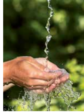
Qi hat wie Wasser unterschiedliche Aggregatzustände

»Der Mensch wird aus dem Qi von Himmel und Erde gebildet. [...] Die Einheit des Qi von Himmel und Erde wird Mensch genannt.«